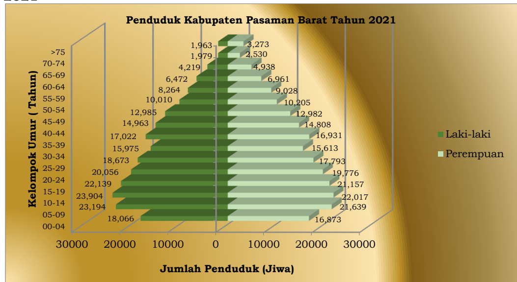
Gambar III.1 Piramida penduduk kabupaten Pasaman Barat Tahun 2021

Pada piramida penduduk dapat dilihat bahwa jumlah penduduk pada kelompok umur 10-19 tahun menunjukkan jumlah yang besar. Data ini harus menjadi perhatian khusus bagi Kabupaten Pasaman Barat karena usia 10-19 tahun merupakan usia remaja dimana kualitas penduduk dengan rentang usia tersebut sangat menentukan bagi masa depan suatu daerah kedepannya. Penduduk lansia (65 tahun ke atas), menunjukkan proporsi yang masih kecil yaitu 4,33 persen. Namun dimasa depan proporsi penduduk lansia akan terus