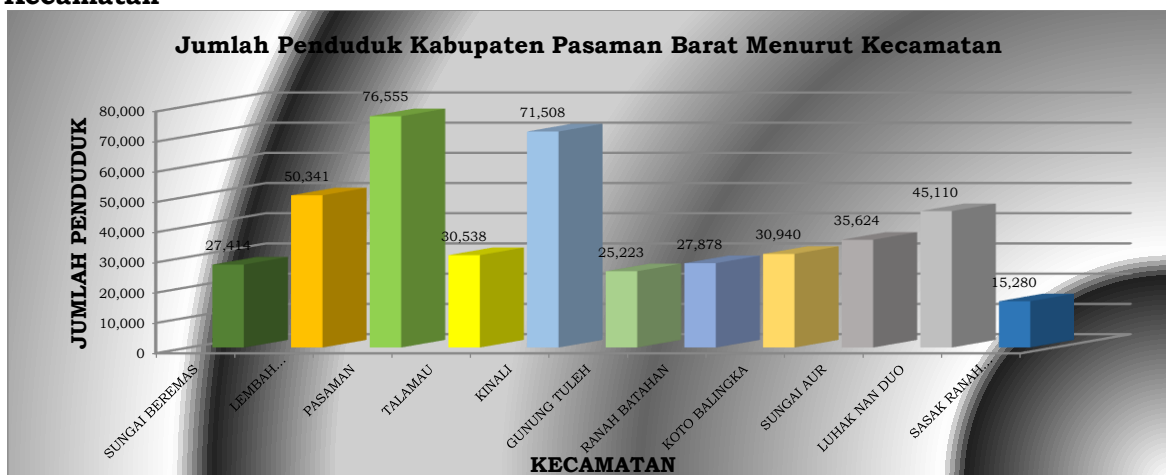
Gambar II.1 Jumlah Penduduk Kabupaten Pasaman Barat Tahun 2021 Menurut Kecamatan