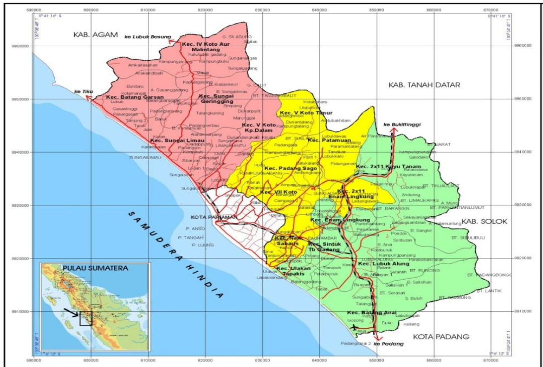
GAMBAR 2.1 Peta Kabupaten Padang Pariaman