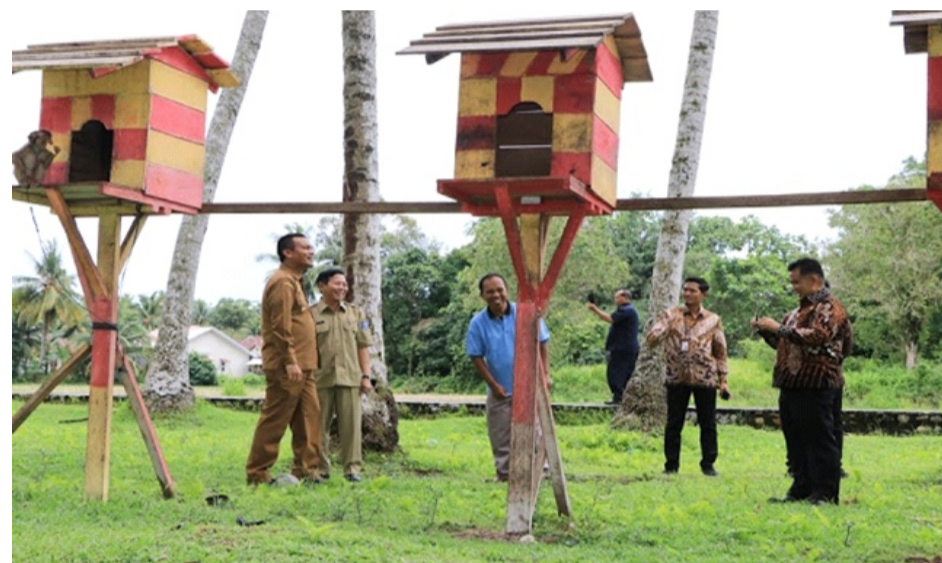
Gambar 2.12 STIB