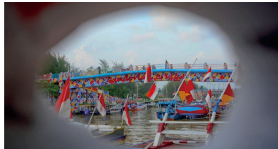
Gambar 2.3 Gandoriah Bridge