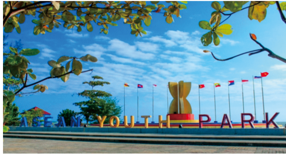
Gambar 2.2 Asean Youth Park