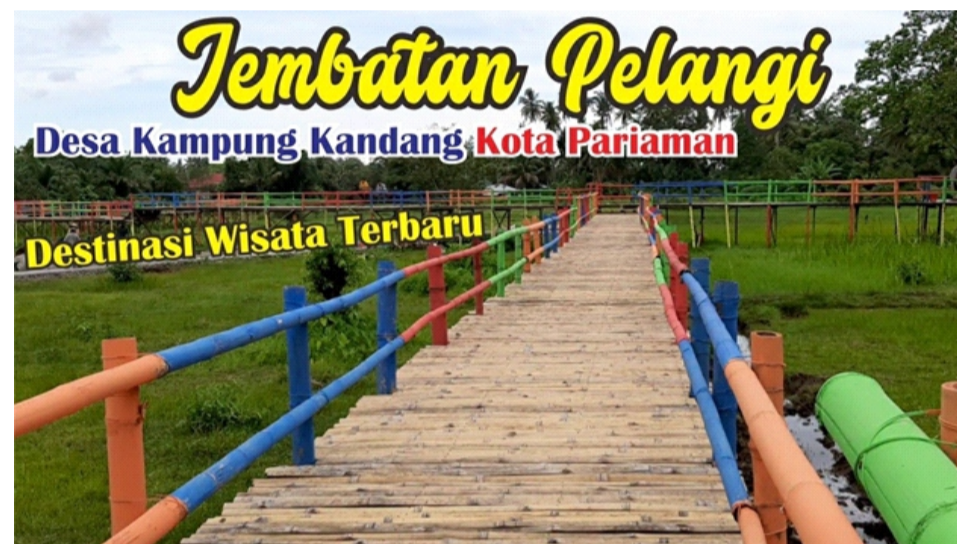
Gambar 2.4 Jembatan Pelangi Desa Kampung Kandang