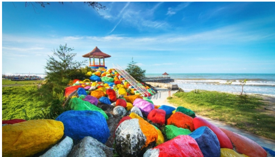
Gambar 2.7 Pantai Kata