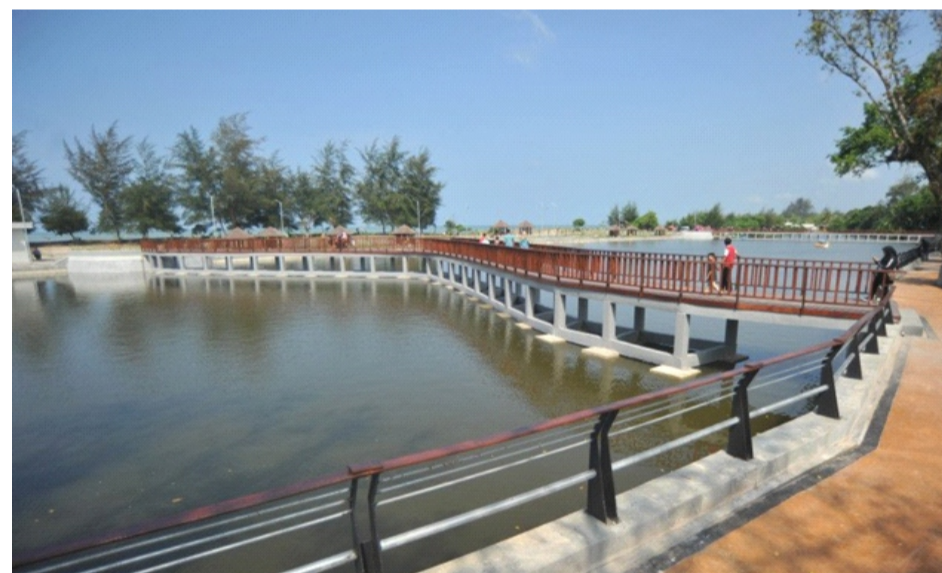
Gambar 2.13 Talao Pauah