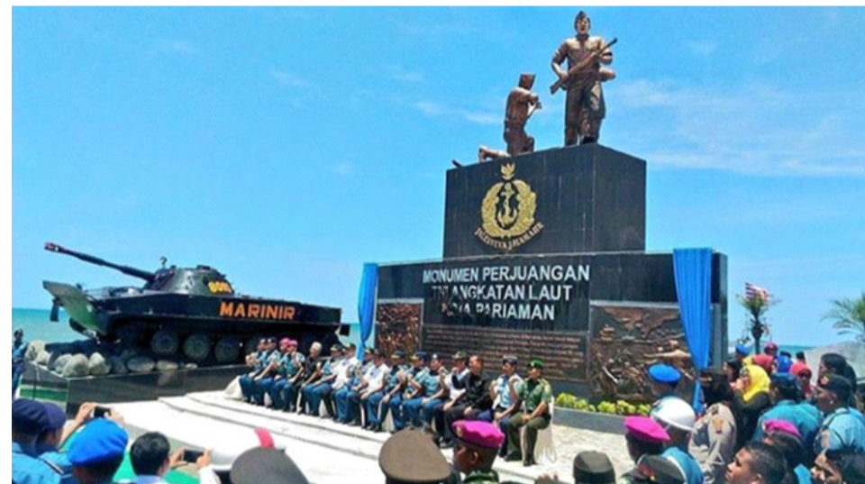
Gambar 2.5 Monumen Perjuangan Angkatan Laut