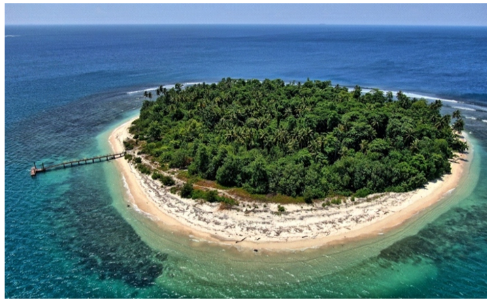
Gambar 2.10 Pulau Tengah