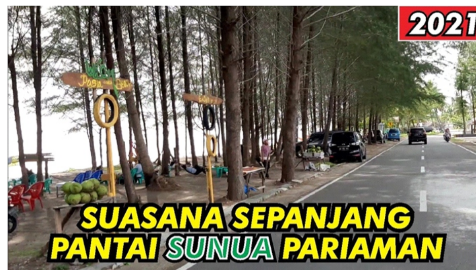
Gambar 2.16 Pantai Sunua