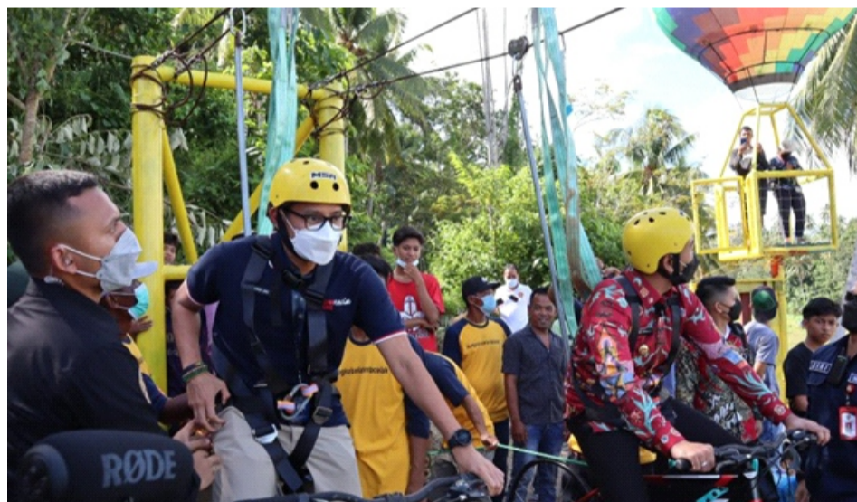
Gambar 2.15 Sepeda Gantung Tungkal Selatan