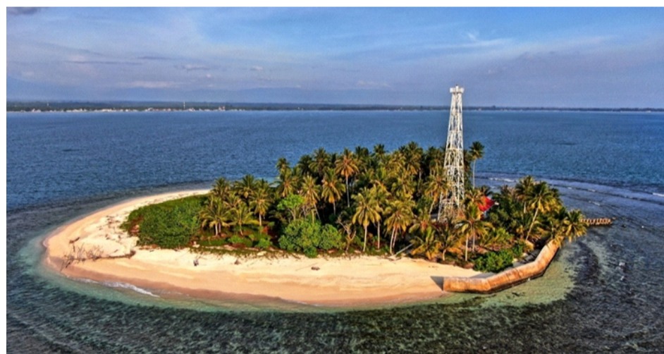
Gambar 2.9 Pulau Kasiak