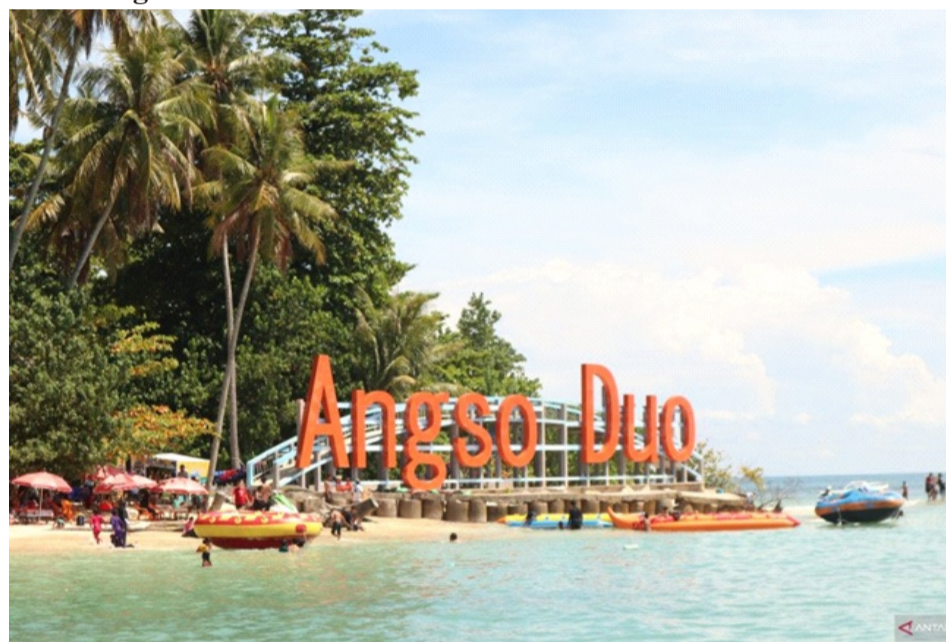
Gambar 2.8 Pulau Angso Duo