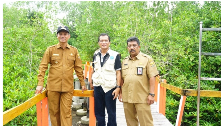
Gambar 2.17 Hutan Mangrove