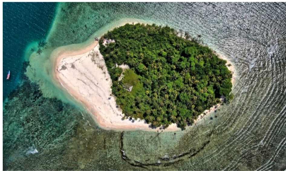
Gambar 2.11 Pulau Ujuang