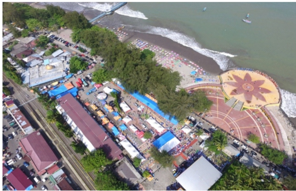
Gambar 2.6 Pantai Gandoriah