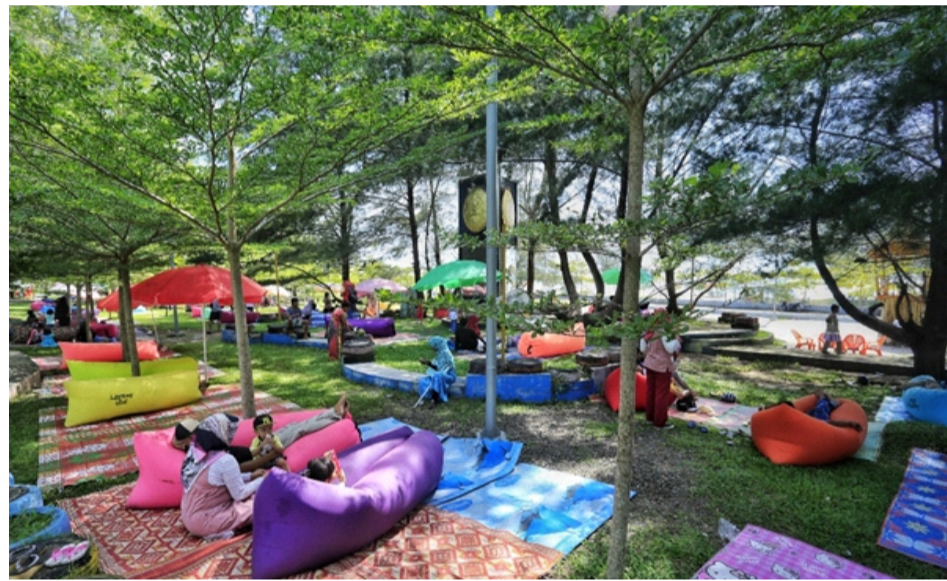
Gambar 2.14 Taman Anas Malik